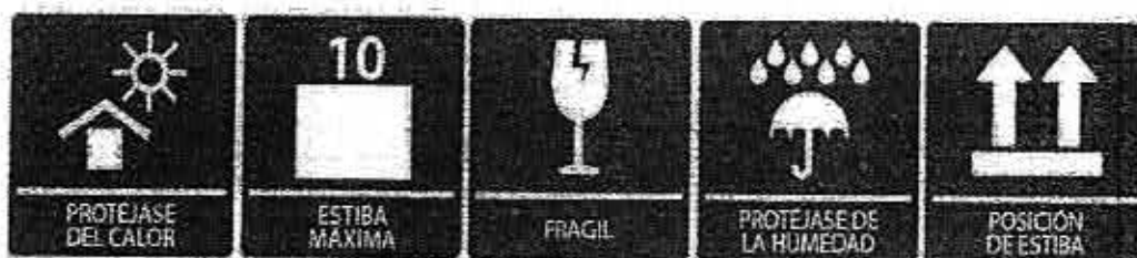
Figura 2. Señalética y ejemplos de etiquetas de identificación por colectivo.