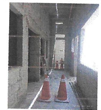
Se continua ejecutando muros de albañileria y dalas