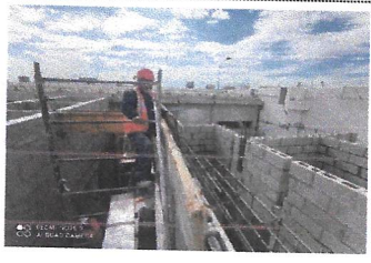
Se continua ejecutando los colados de concreto de dalas y castillos