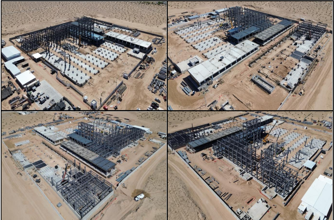
FOTOS AÉREAS GENERALES

San Luis Río Colorado, Sonora 30 de marzo de 2026