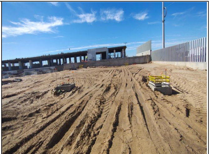
TRABAJOS DE TERRACERÍAS, ARMADO DE REGISTROS Y TENDIDO DE TUBERÍAS SANITARIAS EN OBRAS EXTERIORES