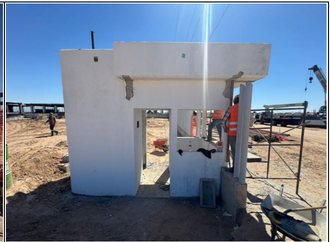
TRABAJOS DE ACABADOS EN CASETA DE URGENCIAS