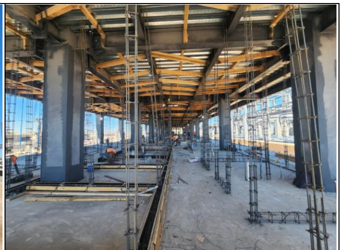
TRABAJOS DE ALBAÑILERÍAS EN LOSA DE ENTREPISO Y COLADO DE CAPA DE COMPRESIÓN EN LOSA DE AZOTEA EN CUERPO DE SERVICIOS GENERALES