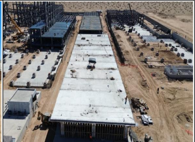
TRABAJOS DE ALBAÑILERÍAS EN LOSA DE ENTREPISO Y COLADO DE CAPA DE COMPRESIÓN EN AZOTEA EN CUERPO DE CASA DE MÁQUINAS