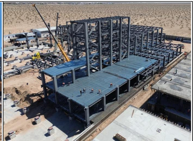
MONTAJE DE ESTRUCTURA METÁLICA, MUROS DE CONFINAMIENTO, COLADO DE FIRMES Y COLOCACIÓN DE LOSACERO EN CUERPO PRINCIPAL