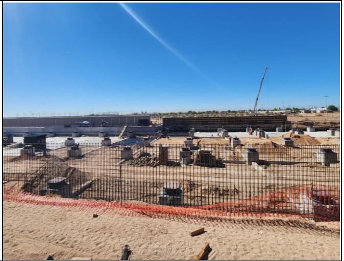
MONTAJE DE ESTRUCTURA METÁLICA, ARMADO Y COLADO DE MUROS DE CONFINAMIENTO Y DE FIRMES EN CUERPO DE ESTACIONAMIENTO