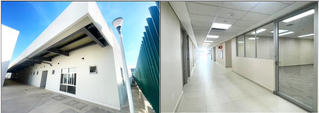
Detalles generales en interior y exterior, Cuerpo 3.