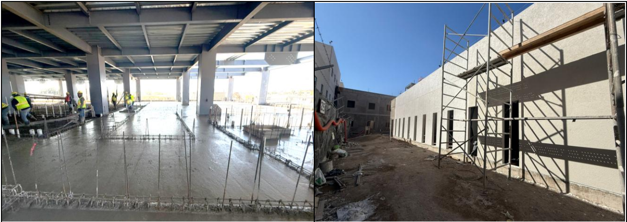
Colados en 1er nivel y avance de emplaste y sellado en fachada, cuerpo 6.