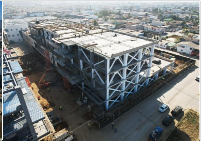
Hospitalización, cuerpo 5.