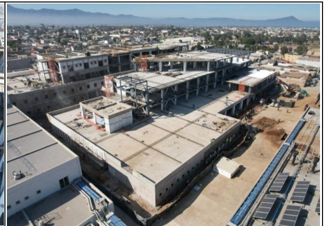
Hospitalización, cuerpo 6