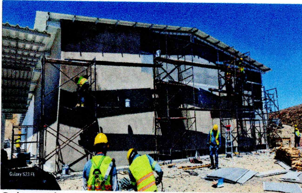
Colocación de Tablamiento en dormitorios