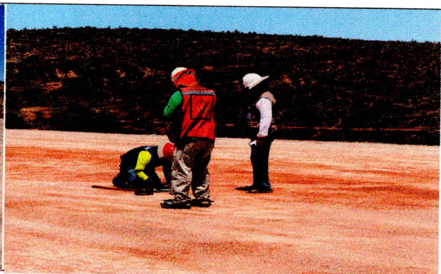
Pruebas de Compactación edificio B1