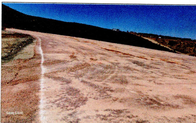
Plataforma en edificio B