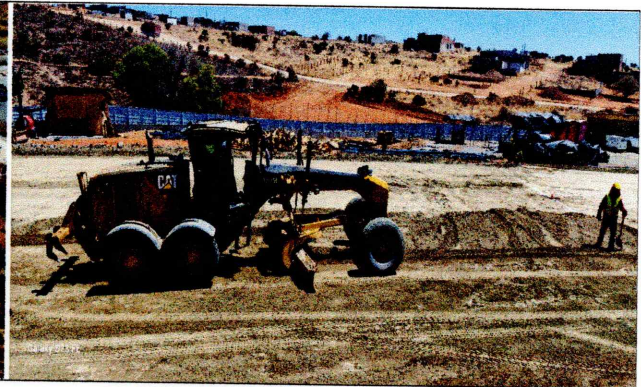
conformación de Plataformas edificio G