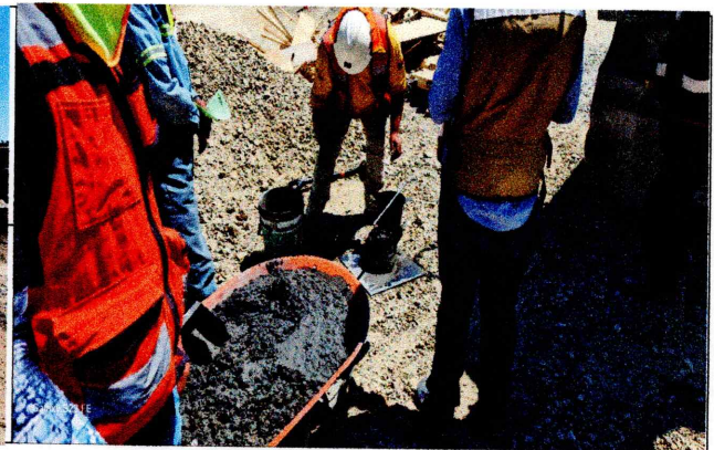
Prueba de Revenimiento de concreto