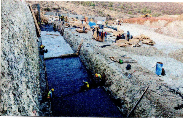
Plantilla de muro perimetral