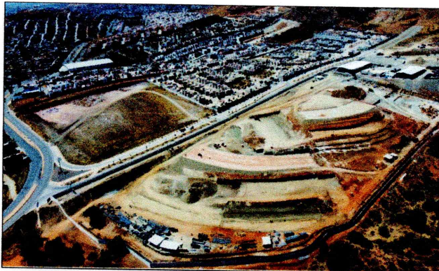
Avance de cimentación de Muro Perimetral