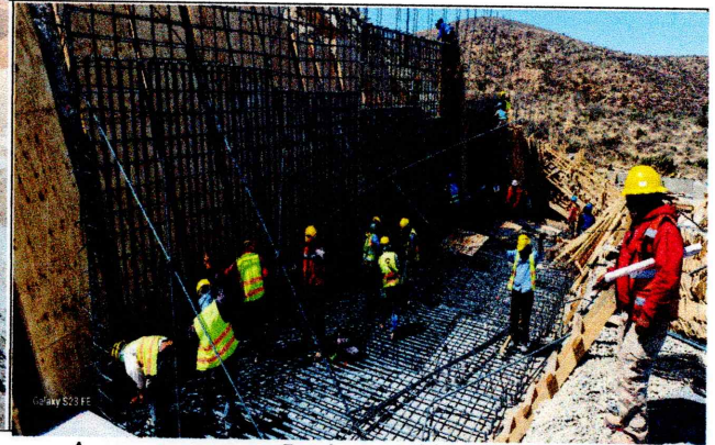
Acero en muro Perimetral lado Oeste