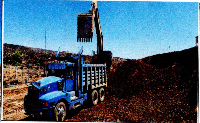
Excavación y retiro material Estacionamiento