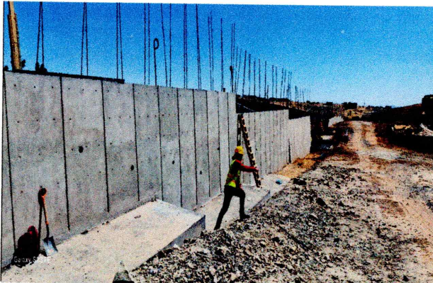
Muro perimetral terminado