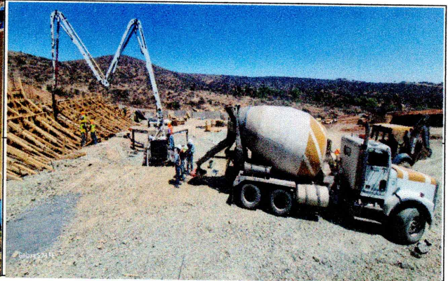
colado de Muro lado oeste