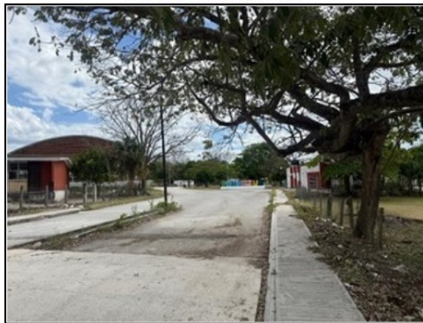
ENTORNO AL ACTIVO