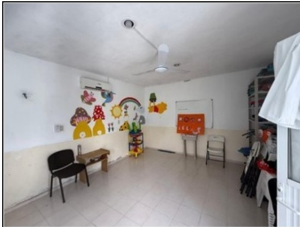
VISTA GENERAL DEL ACTIVO