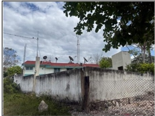
VISTA GENERAL DEL ACTIVO