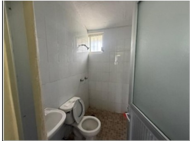
VISTA GENERAL DEL ACTIVO