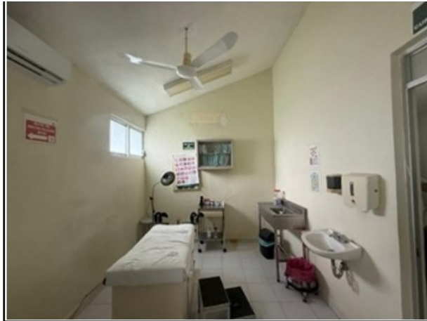
VISTA GENERAL DEL ACTIVO

SOLICITUD: 2026-1162 SECUENCIAL: 04-26-111 GENÉRICO: G-45686-ZND