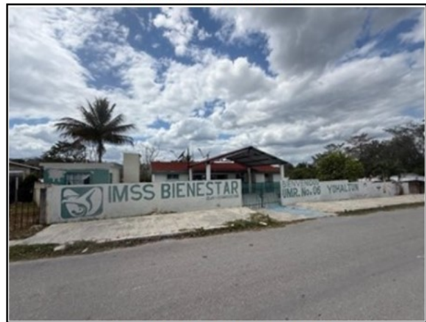
VISTA GENERAL DEL ACTIVO