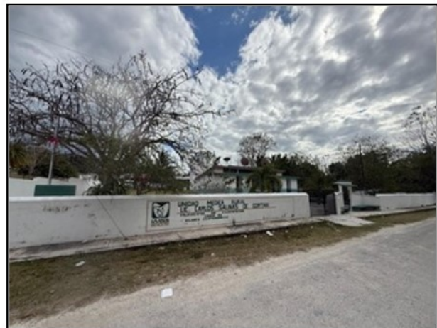
VISTA GENERAL DEL ACTIVO