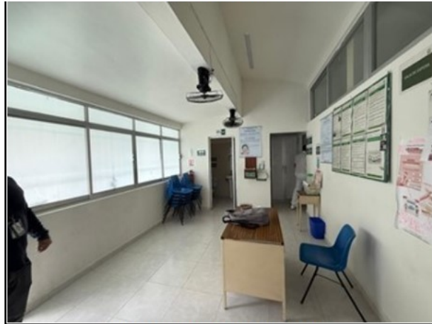
VISTA GENERAL DEL ACTIVO

SOLICITUD: 2026-1161 SECUENCIAL: 04-26-112 GENÉRICO: G-45687-ZND