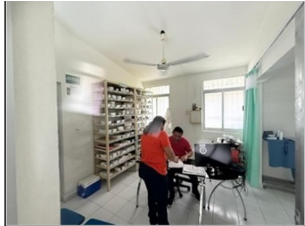
VISTA GENERAL DEL ACTIVO