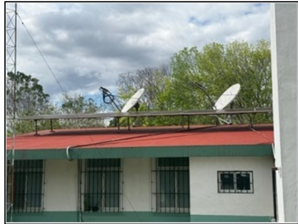
VISTA GENERAL DEL ACTIVO