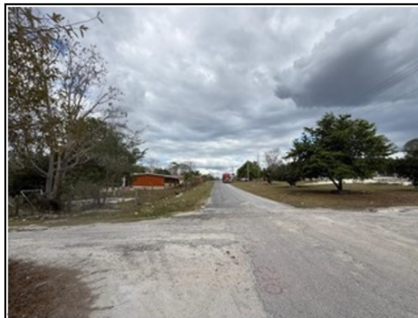
ENTORNO DEL ACTIVO