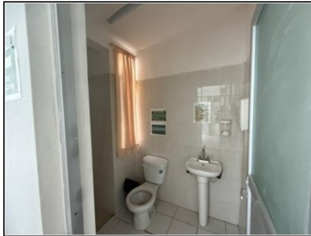
VISTA GENERAL DEL ACTIVO