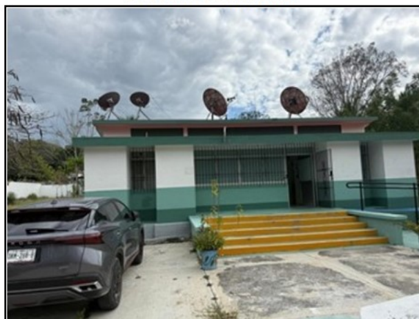
VISTA GENERAL DEL ACTIVO