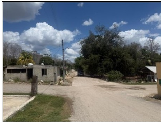
ENTORNO AL ACTIVO