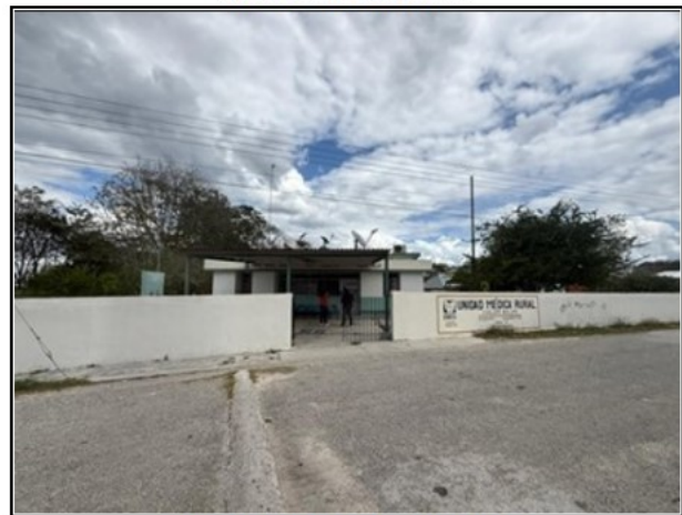
VISTA GENERAL DEL ACTIVO