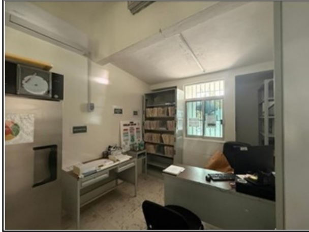
VISTA GENERAL DEL ACTIVO

SOLICITUD: 2026-1159 SECUENCIAL: 04-26-114 GENÉRICO: G-45689-ZND