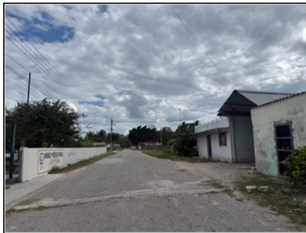
ENTORNO DEL ACTIVO