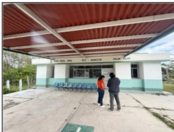
VISTA GENERAL DEL ACTIVO