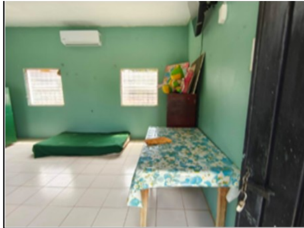
INTERIOR DEL ACTIVO

SOLICITUD: 2026-1158 SECUENCIAL: 04-26-137 GENÉRICO: G-45748-ZND