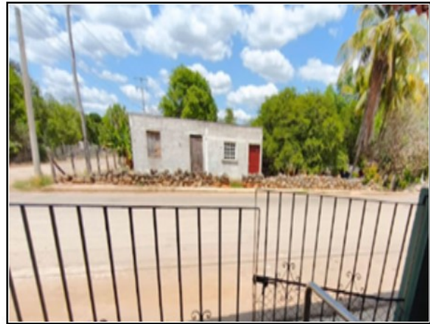
ENTORNO DEL ACTIVO