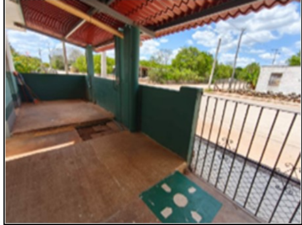
ACTIVO EN ESTUDIO