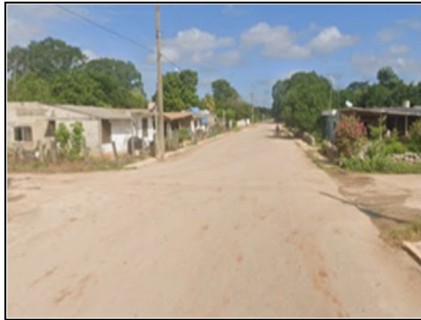
ENTORNO DEL ACTIVO