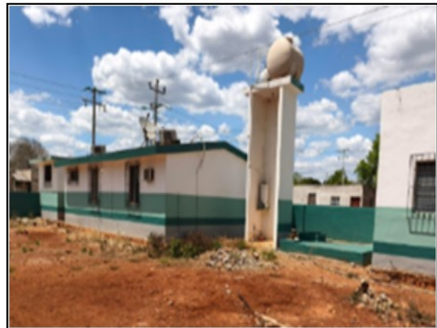
ACTIVO EN ESTUDIO