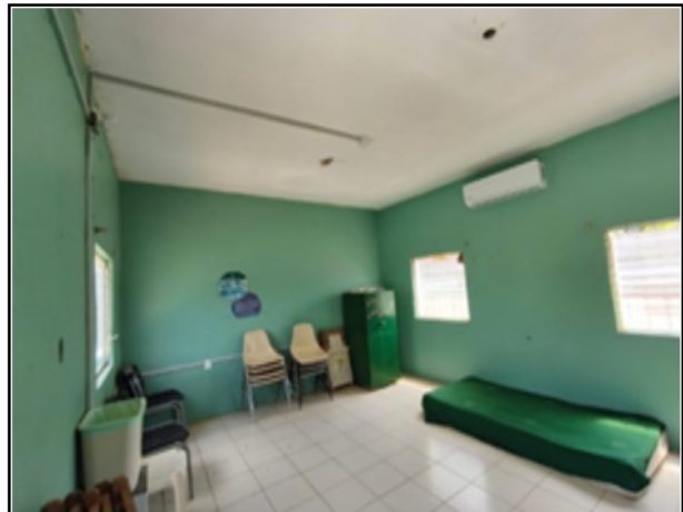
INTERIOR DEL ACTIVO