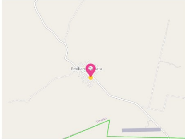
CROQUIS MACRO LOCALIZACIÓN