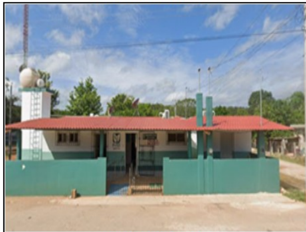
ACTIVO EN ESTUDIO