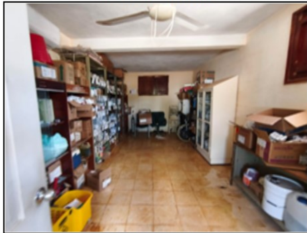
INTERIOR DEL ACTIVO