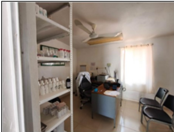
INTERIOR DEL ACTIVO