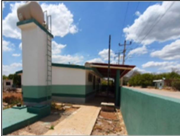
ACTIVO EN ESTUDIO