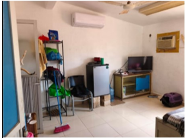
INTERIOR DEL ACTIVO