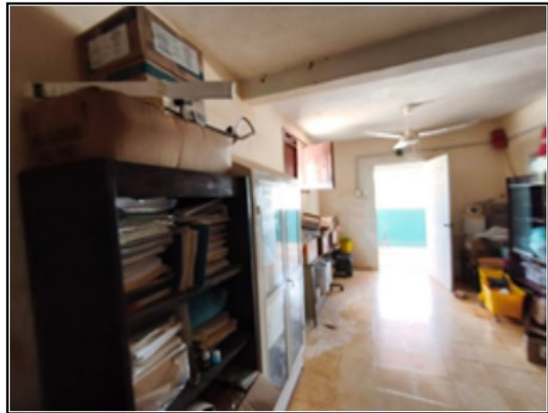
INTERIOR DEL ACTIVO