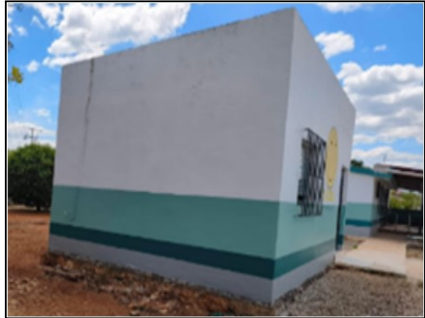
ACTIVO EN ESTUDIO