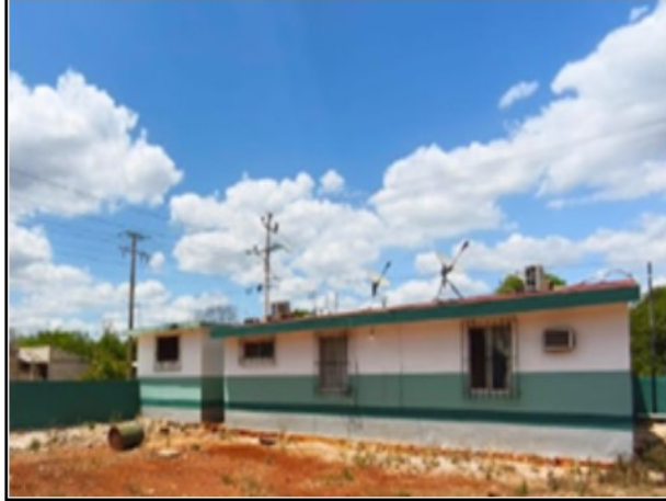
ACTIVO EN ESTUDIO

SOLICITUD: 2026-1158 SECUENCIAL: 04-26-137 GENÉRICO: G-45748-ZND