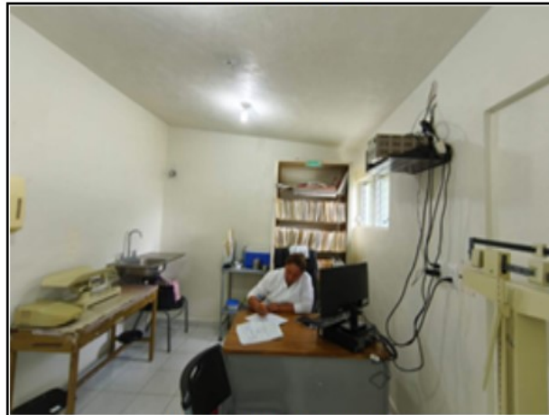
INTERIOR DEL ACTIVO