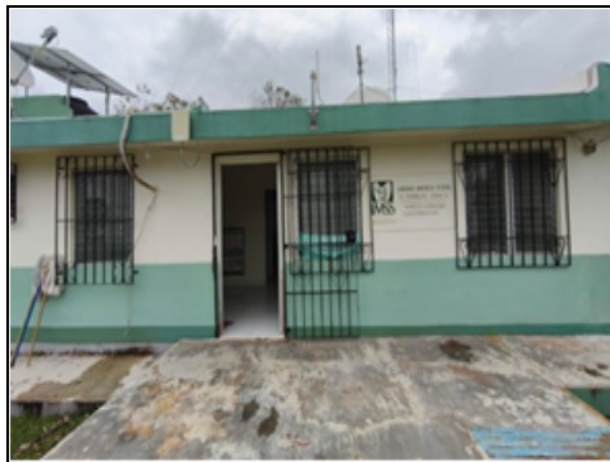
ACTIVO EN ESTUDIO