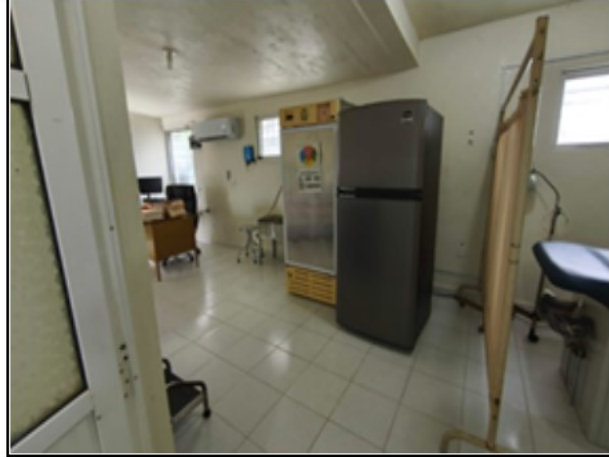
INTERIOR DEL ACTIVO