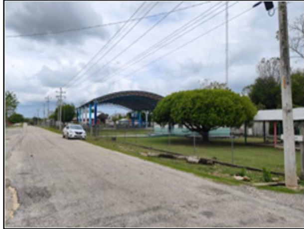
ENTORNO DEL ACTIVO