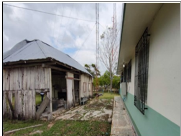
ACTIVO EN ESTUDIO