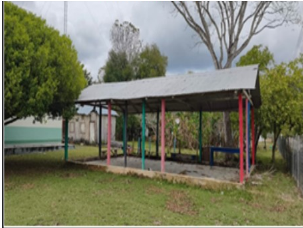
ACTIVO EN ESTUDIO

SOLICITUD: 2026-1157 SECUENCIAL: 04-26-101 GENÉRICO: G-45676-ZND