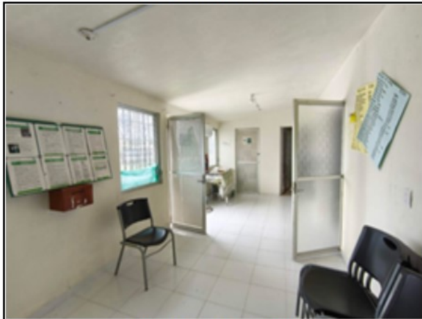
INTERIOR DEL ACTIVO