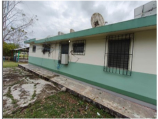
ACTIVO EN ESTUDIO