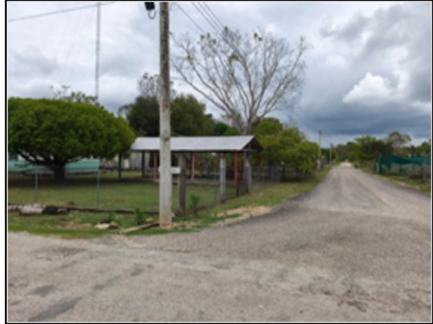
ENTORNO DEL ACTIVO