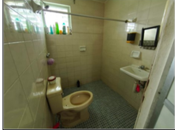
INTERIOR DEL ACTIVO