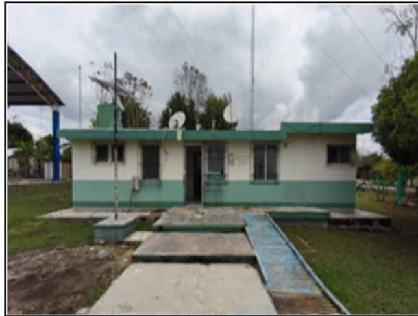
ACTIVO EN ESTUDIO