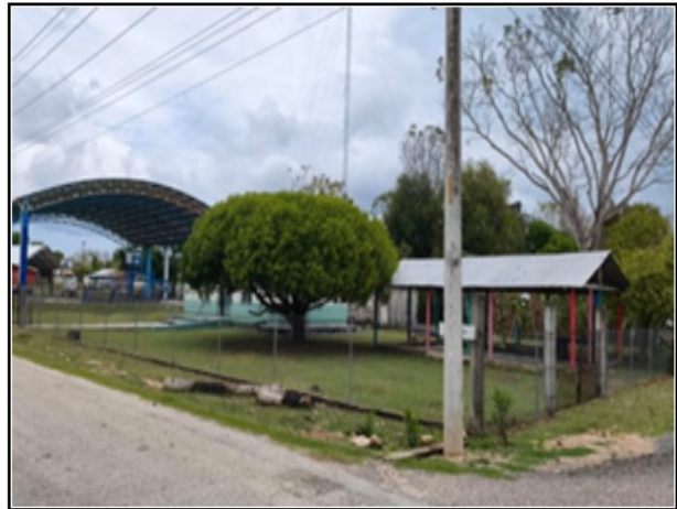
ACTIVO EN ESTUDIO