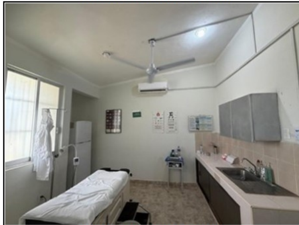
VISTA GENERAL DEL ACTIVO