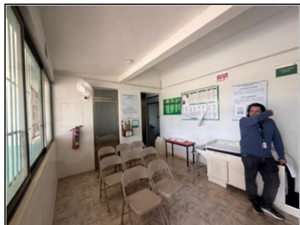
VISTA GENERAL DEL ACTIVO