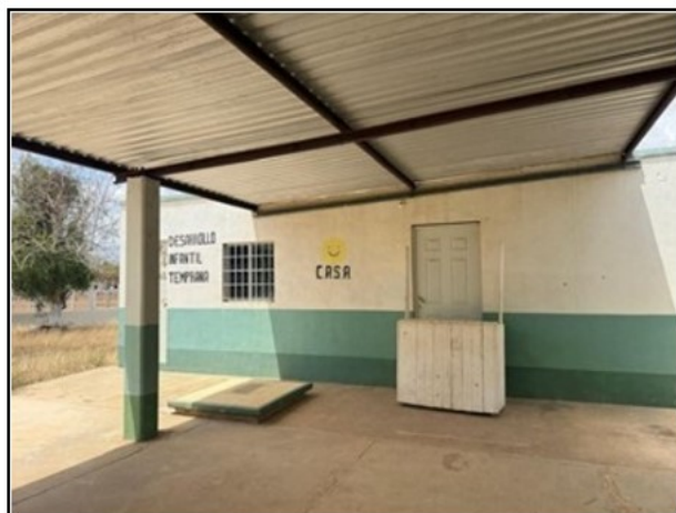
VISTA GENERAL DEL ACTIVO