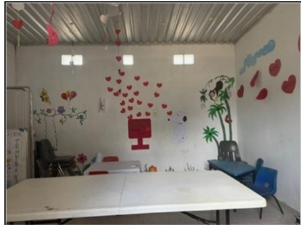
VISTA GENERAL DEL ACTIVO