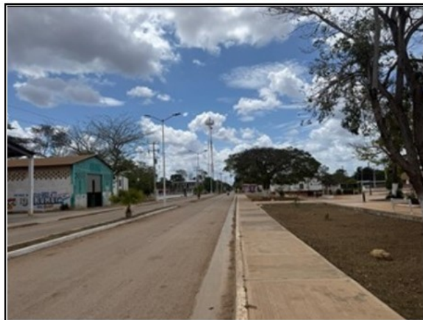
ENTORNO DEL ACTIVO