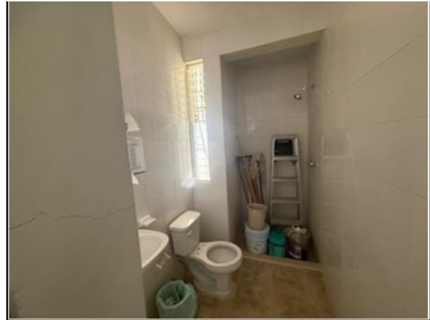
VISTA GENERAL DEL ACTIVO