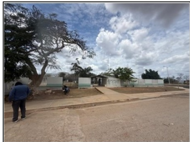
VISTA GENERAL DEL ACTIVO