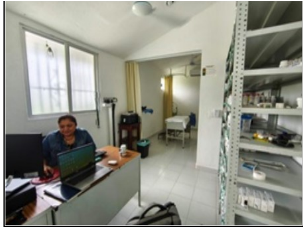
INTERIOR DEL ACTIVO