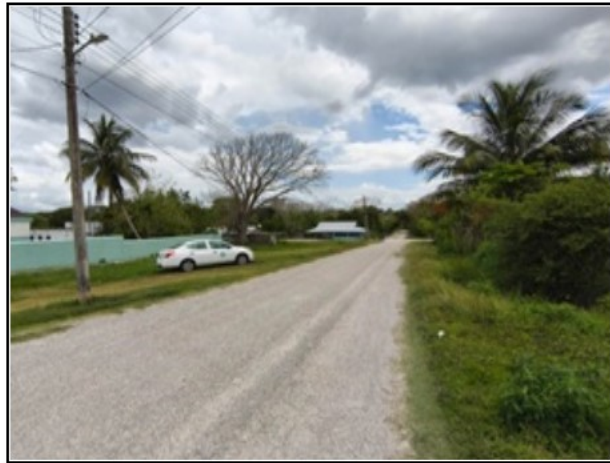
ENTORNO DEL ACTIVO (Calle Libertad)