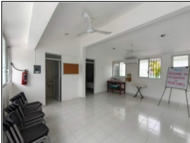
INTERIOR DEL ACTIVO