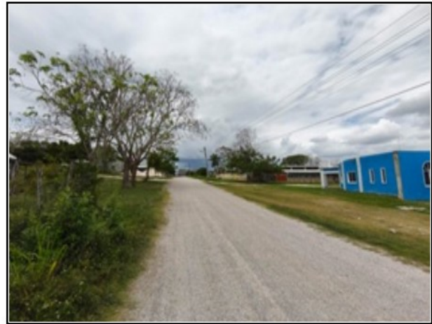
ENTORNO DEL ACTIVO (Calle Libertad)