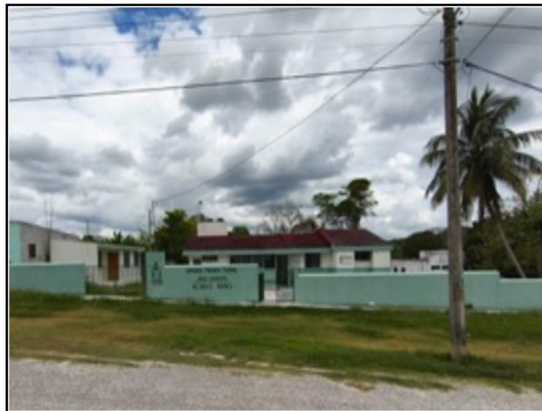
ACTIVO EN ESTUDIO