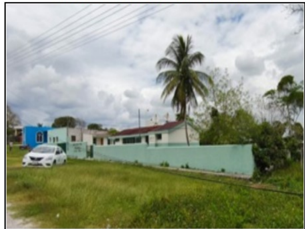
ACTIVO EN ESTUDIO