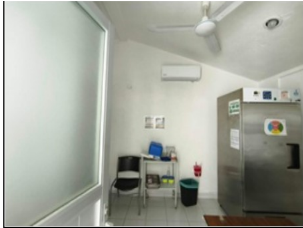
INTERIOR DEL ACTIVO

SOLICITUD: 2026-1149 SECUENCIAL: 04-26-104 GENÉRICO: G-45679-ZND