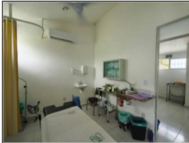
INTERIOR DEL ACTIVO