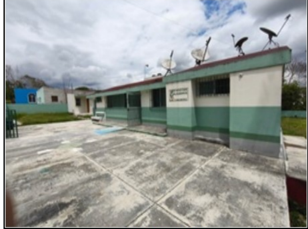
ACTIVO EN ESTUDIO