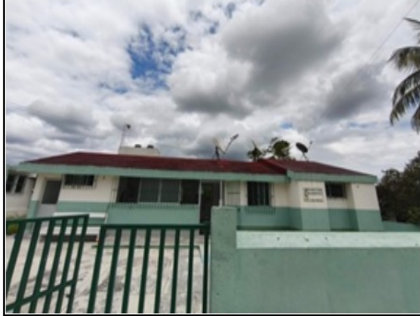
ACTIVO EN ESTUDIO

SOLICITUD: 2026-1149 SECUENCIAL: 04-26-104 GENÉRICO: G-45679-ZND