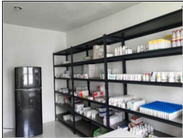
INTERIOR DEL ACTIVO