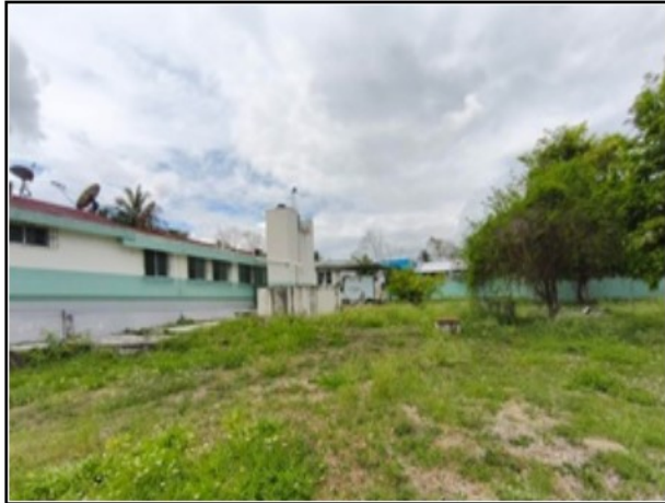
ACTIVO EN ESTUDIO