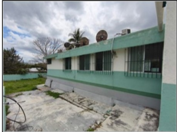
ACTIVO EN ESTUDIO