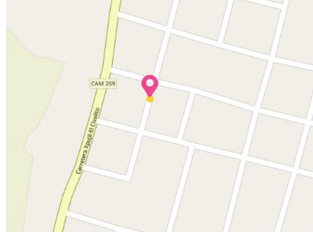
CROQUIS MICRO LOCALIZACIÓN