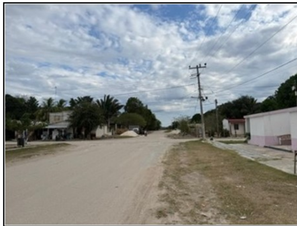
ENTORNO DEL ACTIVO