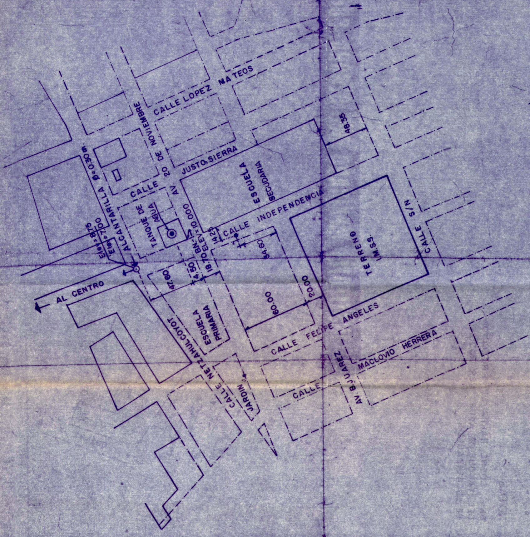
CROQUIS DE LOCALIZACION