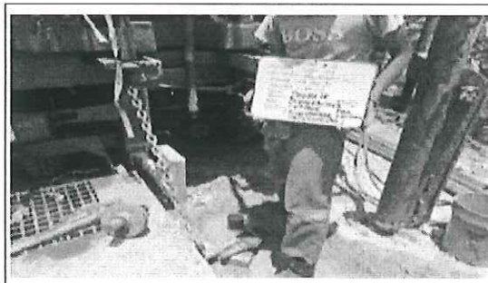
FOTO No. 4: SALA DE ESPERA FOTOGRAFIA TOMADA EL DIA 27 DE SEPTIEMBRE DE 2024