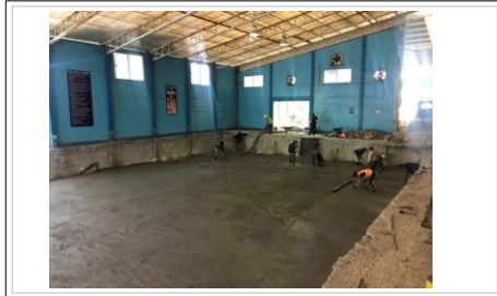
FOTO No. 1: TRABAJOS DE COLADOS DE LA PLANTILLA PARA EL DESPLANTE DEL ACERO.