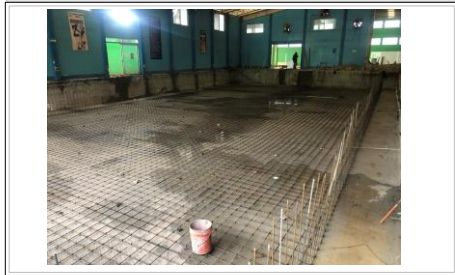
FOTO No. 7: TRABAJOS DE ARMADO DE ACERO DE LA PRIMERA PARRILLA EN EL AREA DEL VASO DE ALBERCA.