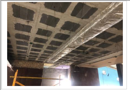
FOTO No. 4: TRABAJOS DE COLOCACION DE CABLEADO PARA IDENTIFICACION DE CIRCUITOS EN AREA DE ACCESO A VESTIDORES.