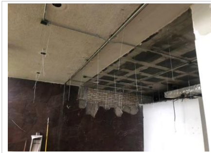
FOTO No. 5: TRABAJOS DE COLOCACION DE SUSPENSION DE LOS PLAFONES EN EL AREA DE LAS OFICINAS .