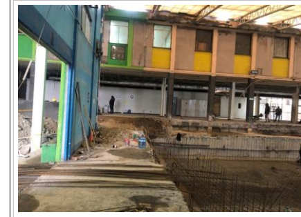
FOTO No. 6: TRABAJOS DE ARMADO DE ACERO DE LA PRIMERA PARRILLA EN EL AREA DE LA TRINCHERA Y VASO DE ALBERCA.