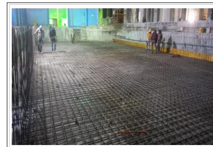
FOTO No. 9: TRABAJOS DE ARMADO DE ACERO DE LA SEGUNDA PARRILLA EN EL AREA DEL VASO DE ALBERCA.