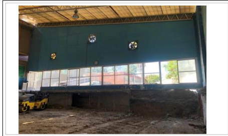
FOTO No. 1: SE SOLICITO EN VISITA A OBRA CON FECHA DEL 09 DE NOVIEMBRE DEL 2023, EL CAMBIO DE LA SECCION DEL CANCEL QUE SE MUESTRA EN ESTA FACHADA.