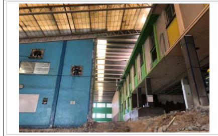
FOTO No. 2: SE TERMINA LA DEMOLICION DEL MURO PERIMETRAL DE LA FACHADA INTERIOR CON FRENTE A LADO DE LAS CANCHAS EXISTENTES.