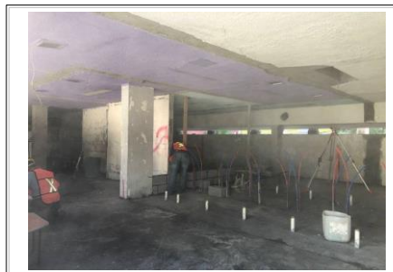
FOTO No. 8: TRABAJOS DE DESPLANTE DE MUROS DE BLOCK PARA LAS SECCIONES DE LA DISTRIBUCION DE LOS VESTIDORES DE HOMBRES Y MUJERES.