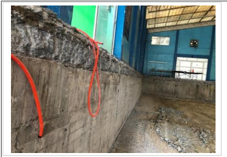
FOTO No. 4: PARED LATERAL DEL PERIMETRO DE LA TRINCHERA QUE YA EXISTIA.