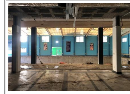
FOTO No. 6: VISUAL EXISTENTE EN LA OBRA, DEL ACCESO PRINCIPAL DEL PROYECTO EJECUTIVO.