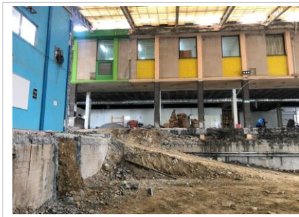
FOTO No. 5: TRABAJOS DE CONFORMACION DE RAMPA DE ACCESO AL AREA DEL VASO DE LA ALBERCA PARA ENTRADA Y SALIDA DE LA MAQUINARA USADA EN EL PROCESO CONSTRUCTIVO.