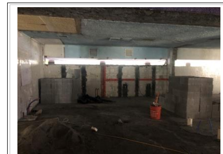
FOTO No. 9: TRABAJOS DE CIERRE DE RANURAS CON CONCRETO EN LAS PREPARACIONES DE LA RED HIDROSANITARIAS DE LAS TOMAS DE LAS MESETAS DE PREPARACION PARA LOS LAVABOS.