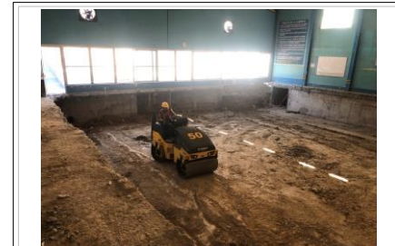
FOTO No. 3 TRABAJOS DE ACARREO, CONFINAMIENTO Y COMPACTACION PARA EL MEJORAMIENTO DEL FIRME DEL AREA DEL VASO DE LA ALBERCA.