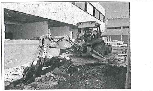
FOTO No. 4: ESTA FOTOGRAFIA FUE TOMADA EL DIA 23 DE OCTUBRE 2023.