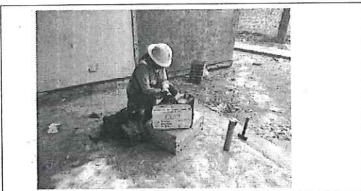
FOTO No. 7: ESTA FOTOGRAFIA FUE TOMADA EL DIA 31 DE OCTUBRE 2023.