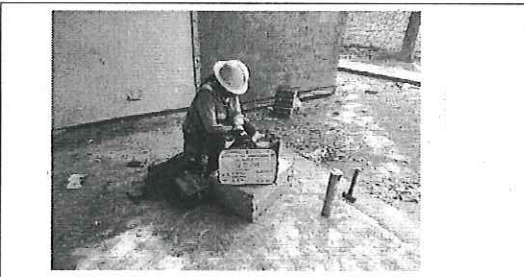
FOTO No. 7: ESTA FOTOGRAFIA FUE TOMADA EL DIA 31 DE OCTUBRE 2023.