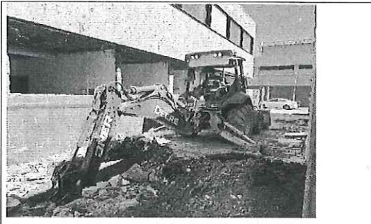
FOTO No. 4: ESTA FOTOGRAFIA FUE TOMADA EL DIA 23 DE OCTUBRE 2023.