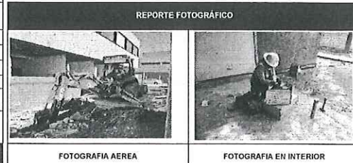
FOTOGRAFIA AEREA FOTOGRAFIA EN INTERIOR

FECHA DE ACTUALIZACIÓN: 30 de noviembre de 2023