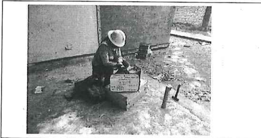
FOTO No. 7: ESTA FOTOGRAFIA FUE TOMADA EL DIA 31 DE OCTUBRE 2023.