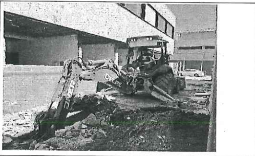
FOTO No. 4: ESTA FOTOGRAFIA FUE TOMADA EL DIA 23 DE OCTUBRE 2023.