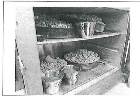
FOTO No. 5: ESTA FOTOGRAFIA FUE TOMADA EL DIA 23 DE OCTUBRE 2023.