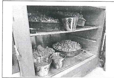
FOTO No. 5: ESTA FOTOGRAFIA FUE TOMADA EL DIA 23 DE OCTUBRE 2023.