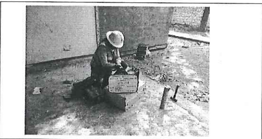
FOTO No. 7: ESTA FOTOGRAFIA FUE TOMADA EL DIA 31 DE OCTUBRE 2023.