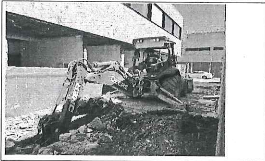
FOTO No. 4: ESTA FOTOGRAFIA FUE TOMADA EL DIA 23 DE OCTUBRE 2023.