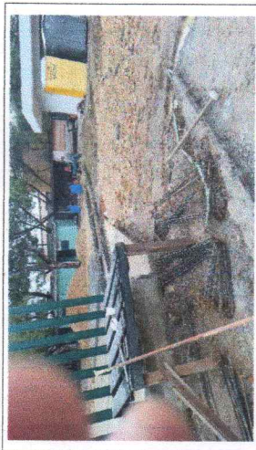
FOTO No. 4: HABILITACION DE ACERO PARA ALFARDAS ESTA FOTOGRAFIA FUE TOMADA EL DIA 28 DE NOVIEMBRE DE 2023.