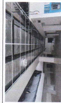
FOTO No. 8: INSTALACION DE SOPORTERIA DE PLAFON ESTRUCTURADO FOTOGRAFIA FUE TOMADA EL DIA 29 DE NOVIEMBRE DE 2023.