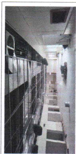
FOTO No. 7: INSTALACION DE SOPORTERIA DE PLAFON ESTRUCTURADO ESTA FOTOGRAFIA FUE TOMADA EL DIA 29 DE NOVIEMBRE DE 2023.