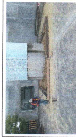
FOTO No. 9: CONSTRUCCION DE GUARIONES EN JARDINES ESTA FOTOGRAFIA FUE TOMADA EL DIA 29 DE NOVIEMBRE DE 2023