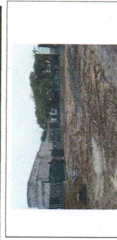
FOTO No. 3 TRAZO DE VIALIDADES EN OBRA EXTERIOR, DEMOLICION DE CONCRETO EXISTENTE FOTOGRAFIA TOMADA EL DIA 24 DE NOVIEMBRE DE 2023