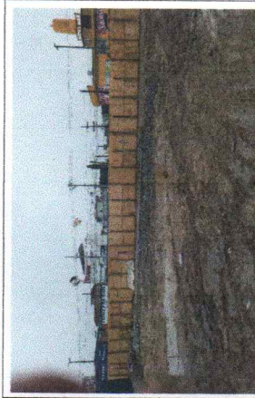
FOTO No. 5: INSTALACION DE SOPORTERIA DE PLAFON ESTRUCTURADO ESTA FOTOGRAFIA FUE TOMADA EL DIA 29 DE NOVIEMBRE DE 2023.