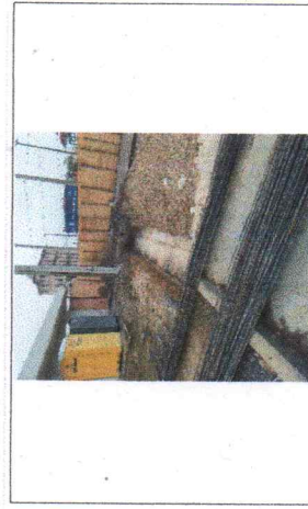
FOTO No. 6 EXCAVACION PARA ALFARDAS Y PLANTILLA DE CIMENTACION. ESTA FOTOGRAFIA FUE TOMADA EL DIA 29 DE NOVIEMBRE DE 2023.