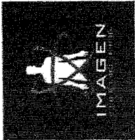
IMAGEN - CDI CENTRO DE DIAGNOSTICO INTEGRAL Pasco Miguel de la Madrid Hurrado 271, Plaza Sendera, SA-PB-07 CITAS POR TELEFONO: 3121360575 CITAS POR WhatsApp: 3121099460 URGENCIAS: 3121259278