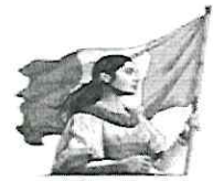
TABLA DE ANEXOS