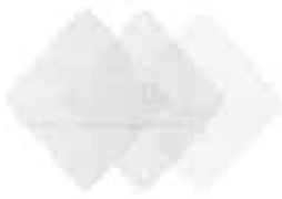
Claves Requeridas por Rango de Importes Totales