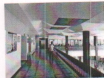
SALA DE ESPERA GENERAL Y PASILLOS DE DISTRIBUCION GENERAL PLANTA ALTA