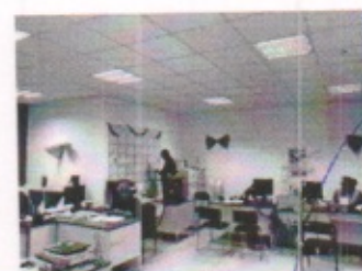
CONSULTORIO TIPO, POZO DE LUZ INTERNO CON ESTRUCTURACION DE CONCRETO Y AREAS ADMINISTRATIVAS GENERALES PLANTA ALTA