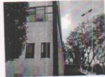
AREAS ADMINISTRATIVAS GENERALES, SALA AUDIOVISUAL Y VISTA GENERAL DE ESTRUCTURACION