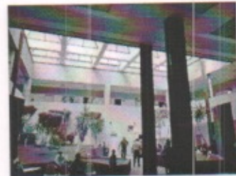
ACCESO PRINCIPAL CON VESTIBULO DE DISTRIBUCION GENERAL Y SALA DE ESPERA GENERAL