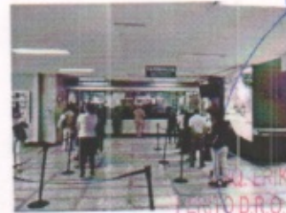
VESTIBULO DE DISTRIBUCION GENERAL, FARMACIA Y SERVICIOS ADMINISTRATIVOS PLANTA BAJA

FRAY J. ANTONIO PEREZ CALAMA # 272, COL. LAZARO CARDENAS, MORELIA, MICHOACAN, C.P. 58229 TELEFONO/FAX: (443) 323-2989