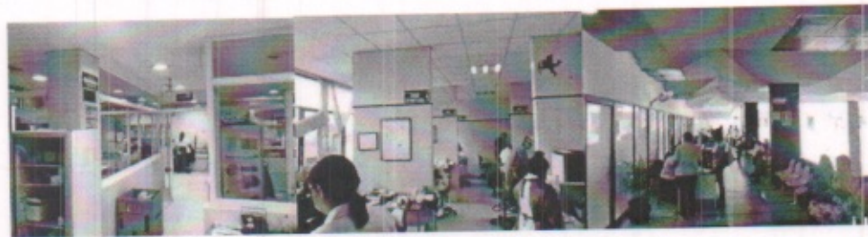
AREA DE LABORATORIOS EN GENERAL, ESTOMATOLOGIA Y PASILLOS DE DISTRIBUCION CON SALA DE ESPERA EN PLANTA ALTA