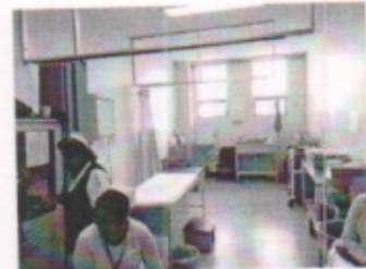
SALA DE ESPERA GENERAL Y CONSULTORIOS TIPO CON AUSCULTACION PLANTA BAJA