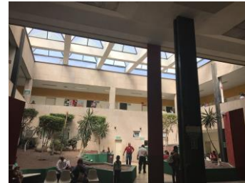
ACCESO PRINCIPAL CON VESTIBULO DE DISTRIBUCION GENERAL Y SALA DE ESPERA GENERAL