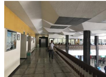
SALA DE ESPERA GENERAL Y PASILLOS DE DISTRIBUCION GENERAL PLANTA ALTA