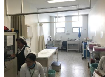
SALA DE ESPERA GENERAL Y CONSULTORIOS TIPO CON AUSCULTACION PLANTA BAJA