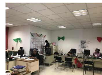
CONSULTORIO TIPO, POZO DE LUZ INTERNO CON ESTRUCTURACION DE CONCRETO Y AREAS ADMINISTRATIVAS GENERALES PLANTA ALTA