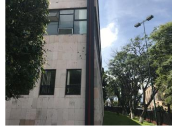
AREAS ADMINISTRATIVAS GENERALES, SALA AUDIOVISUAL Y VISTA GENERAL DE ESTRUCTURACION