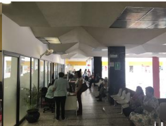
AREA DE LABORATORIOS EN GENERAL, ESTOMATOLOGIA Y PASILLOS DE DISTRIBUCION CON SALA DE ESPERA EN PLANTA ALTA