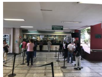
VESTIBULO DE DISTRIBUCION GENERAL, FARMACIA Y SERVICIOS ADMINISTRATIVOS PLANTA BAJA