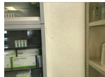
FALLA DE TENSION DIAGONAL EN VIGAS DE ACOPLAMIENTO EN MUROS DE CORTANTE Y ASENTAMIENTOS DIFERENCIALES POR FUERZAS DE CORTANTES OCASIONADOS POR EL SISMO