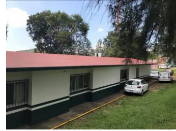
DAÑOS EN JUNTAS FRIAS EN MUROS CON COLUMNAS, VERTICALES CON UNA SEPARACION PROMEDIO DE 1.60mm A 3.00mm. FALLA DE TENSION DIAGONAL EN VIGAS DE ACOPLAMIENTO EN MUROS DE CORTANTE Y ASENTAMIENTOS DIFERENCIALES POR FUERZAS DE CORTANTES OCASIONADOS POR EL SISMO