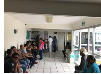
VISTA GENERAL DE ESCALERAS DE ACCESO Y SALA DE ESPERA GENERAL