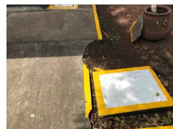
ASENTAMIENTOS DIFERENCIALES POR FUERZAS DE CORTANTES OCASIONADOS POR EL SISMO