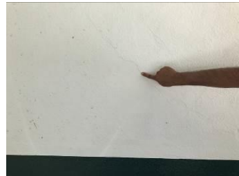
DAÑOS EN JUNTAS FRIAS EN MUROS CON TRABES, HORIZONTALES CON UNA SEPARACION PROMEDIO DE 1.80mm. QUE SON GRIETAS HORIZONTALES EN CORONA, FALLA DE TENSION DIAGONAL EN VIGAS DE ACOPLAMIENTO EN MUROS DE CORTANTE Y ASENTAMIENTOS DIFERENCIALES POR FUERZAS DE CORTANTES OCASIONADOS POR EL SISMO