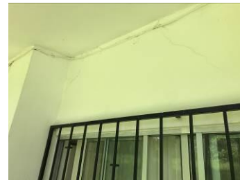
FALLA DE TENSION DIAGONAL EN VIGAS DE ACOPLAMIENTO EN MUROS DE CORTANTE Y ASENTAMIENTOS DIFERENCIALES POR FUERZAS DE CORTANTES OCASIONADOS POR EL SISMO