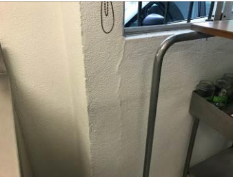
FALLA DE TENSION DIAGONAL EN VIGAS DE ACOPLAMIENTO EN MUROS DE CORTANTE Y ASENTAMIENTOS DIFERENCIALES POR FUERZAS DE CORTANTES OCASIONADOS POR EL SISMO

FOLIO No. 0053/2017/SEPTIEMBRE/PCM-UMF70/ZINAPECUARO/IMSS-GF