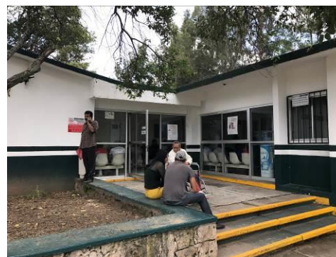
PLAZA DE ACCESO Y ACCESO PRINCIPAL A LA UNIDAD MEDICO FAMILIAR