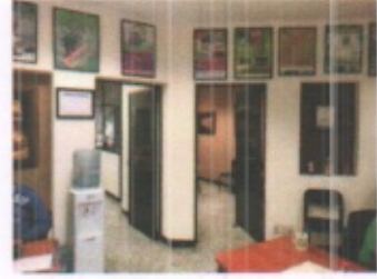
SANITARIOS EN GENERAL Y AREAS ADMINISTRATIVAS EN GENERAL PLANTA ALTA