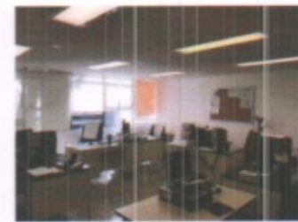
VISTA GENERAL DE AREAS ADMINISTRATIVAS PLANTA ALTA