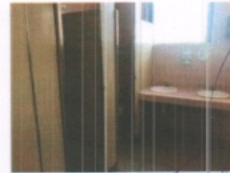
AREAS ADMINISTRATIVAS Y SANITARIOS EN GENERAL PERSONAL Y USUARIOS PLANTA ALTA