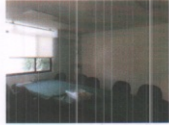
AREAS ADMINISTRATIVAS EN GENERAL Y SALA DE JUNTAS PLANTA ALTA