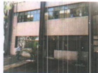
VISTA GENERAL DE FACHADAS EN GENERAL Y AREAS DE ACCESO A DIVERSAS AREAS ADMINISTRATIVAS