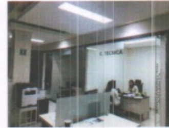
OFICINAS ADMINISTRATIVAS AREA DE CONSTRUCCION, ACCESO PRINCIPAL DELEGACION Y CUBICULOS TIPO DE ATENCION EN PLANTA BAJA