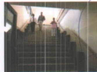
VISTA GENERAL DE ASUNTOS JURIDICOS Y CUBO DE ESCAELRAS EN GENERAL PLANTA BAJA

ARQ. ERIK QUINTANAR REYNA PERITO D.R.O. Y ESTRUCTURAS: A 3663 CEDULA PROFESIONAL 2262839 H. AYUNTAMIENTO DE MORELIA MICH.