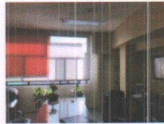
SALA DE JUNTAS TIPO, SANITARIO GENERAL Y CUBICULO DE DIRECTIVO TIPO PLANTA ALTA