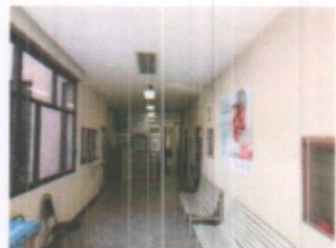
VISTA GENERAL DE EDIFICIO, AREAS ADMINISTRATIVAS Y PASILLOS DE DISTRIBUCION EN GENERAL PLANTA BAJA