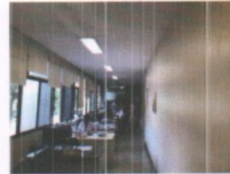
VISTA GENERAL DE AREAS ADMINISTRATIVAS Y PASILLOS DE DISTRIBUCION EN PLANTA ALTA