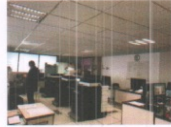
ACCESO A PLANTA ALTA DEPARTAMENTO DE INFORMATICA CON AREAS DE TRABAJO GENERAL PLANTA ALTA