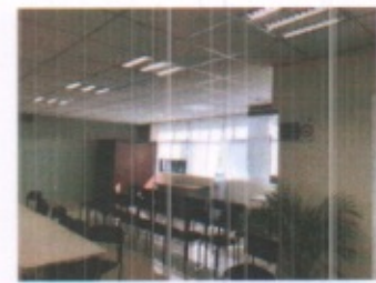
CUBICULO TIPO OFICINA ADMINISTRATIVA Y SALA AUDIOVISUAL DE JUNTAS Y ENSEÑANZA PLANTA ALTA