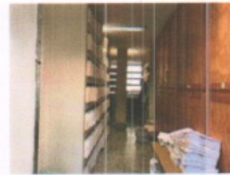
OFICINAS ADMINISTRATIVAS EN GENERAL Y ARCHIVO GENERAL PLANTA BAJA SE OBSERVA UNA FISURA POR ADHERENCIA OCASIONADO POR EL SISMO