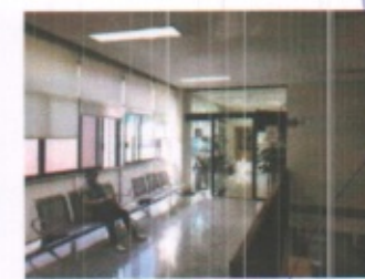
DETALLE DE ESTRUCTURACION GENERAL DE COLUMNAS, TRABES, MUROS DE CARGA, LOSAS DE ENTREPISO Y CUBIERTA, ASI COMO AREAS ADMINISTRATIVAS EN AREA DE FINANZAS