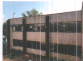
FACHADAS EN GENERAL Y CUBIERTA TIPO DE CRUZ EN BOVEDILLA EN PASILLOS DE ACCESO