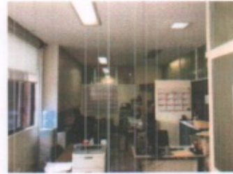
VISTA GENERAL DE AREAS ADMINISTRATIVAS Y PASILLOS DE DISTRIBUCION PLANTA ALTA