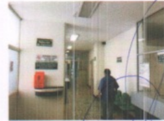
AREAS ADMINISTRATIVAS EN GENERAL, ESCALERAS DE ACCESO Y PASILLO DE DISTRIBUCION PLANTA ALTA ENSEÑANZA MEDICA Y LABORAL