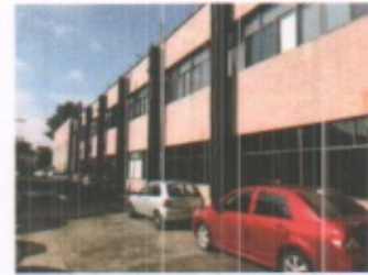
AREAS EXTERIORES EN GENERAL