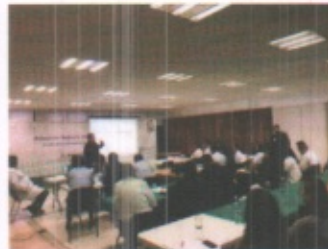
SALA AUDIOVISUAL O SALON DE USOS MULTIPLES PLANTA ALTA

FOLIO No. 0035/2017/SEPTIEMBRE/PCM-DRM-MLM-IMSS/GF