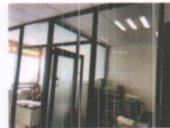
PASILLO DE DISTRIBUCION EN ENSEÑANZA MEDICA Y CUBICULOS TIPO DE OFICINAS EN GENERAL PLANTA ALTA