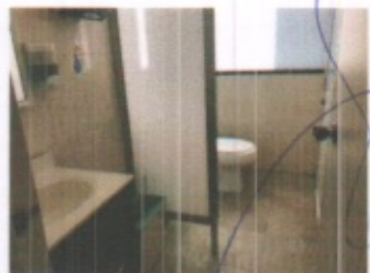
VISTA GENERAL DE OFICINAS ADMINSTRATIVAS Y SANITARIOS PERSONAL LABORAL EN GENERAL PLANTA BAJA