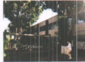
AREAS EXTERIORES EN GENERAL