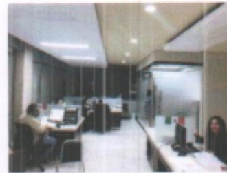
AREAS ADMINISTRATIVAS EN GENERAL PLANTA ALTA