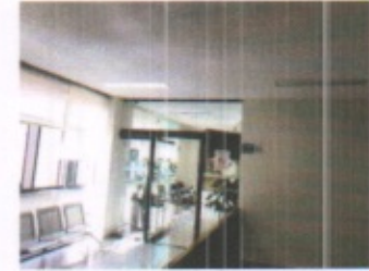
OFICINA TIPO DIRECTIVO Y DETALLE ESTRUCTURAL DE JUNTA CONSTRUCTIVA Y ACCESO DELEGACION GENERAL PLANTA ALTA