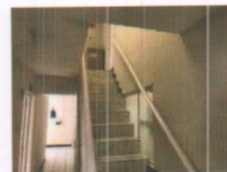
OFICINAS ADMINISTRATIVAS EN GENERAL, VETIBULO DE DISTRIBUCION Y CUBO DE ESCALERAS PLANTA BAJA