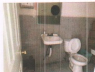
OFICINAS TIPO Y SANITARIOS PERSONAL IMSS PLANTA BAJA