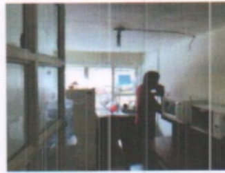
VESTIBULO DE DISTRIBUCION, OFINA ADMINISTRATIVA TIPO Y COMEDOR PERSONAL IMSS PLANTA ALTA