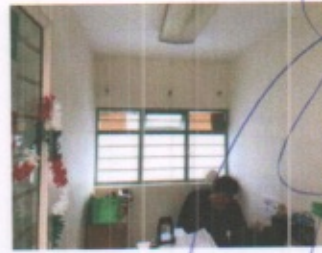
OFICINAS ADMINISTRATIVAS, SALON DE USOS MULTIPLES Y CUBICULO TIPO PLANTA BAJA