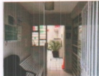
FACHADAS PRINCIPALES Y ACCESO PRINCIPAL