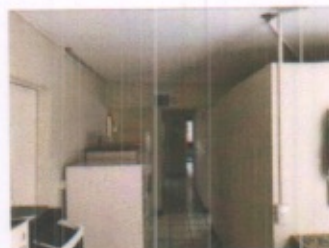
SANITARIO PERSONAL IMSS, DETALLE DE ARMADO DE ACERO EN CUBO DE LUZ Y VESTIBULO CON PASILLOS DE DISTRIBUCION GENERAL PLANTA BAJA