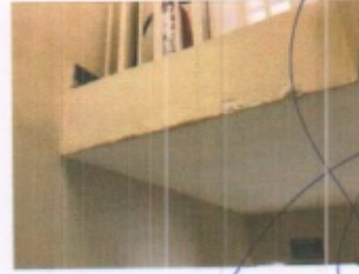
VISTA GENERAL DE CUBO DE ESCALERAS, SANITARIO PERSONAL IMSS Y DETALLE DE LOSA DE ENTREPISO PLANTA ALTA

FOLIO No. 0036/2017/SEPTIEMBRE/PCM-DRC-MLM-IMSS/GF