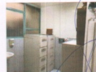
AREAS ADMINISTRATIVAS TIPO Y AREA DE ARCHIVO PLANTA BAJA

FRAY J. ANTONIO PEREZ CALAMA # 272, COL. LAZARO CARDENAS, MORELIA, MICHOACAN, C.P. 58229