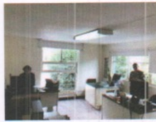
VISTA GENERAL DE AREAS ADMINSTRATIVAS VARIAS EN PLANTA ALTA