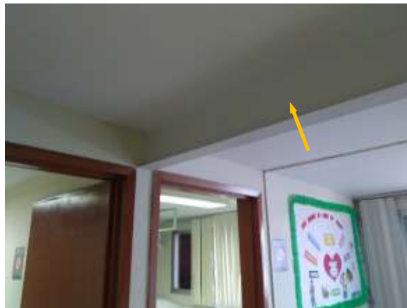
Foto 4. Vigas de acero de la UMF No. 80 Satélite

Marcos y muros de concreto reforzado, dispuestos en dos direcciones ortogonales, (Foto 4). Las traveses reforzadas con perfiles W (IR) de acero.