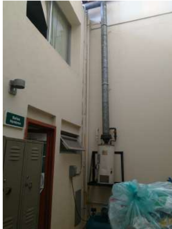
Foto 5. Vista del patio de servicio

No se observan hundimientos, inclinaciones, agrietamientos, desplazamientos o deformaciones en el sistema estructural global del Edificio. Tampoco se aprecia ningún tipo de daño en elementos estructurales individuales. NO se aprecia daño alguno, (Foto 5).