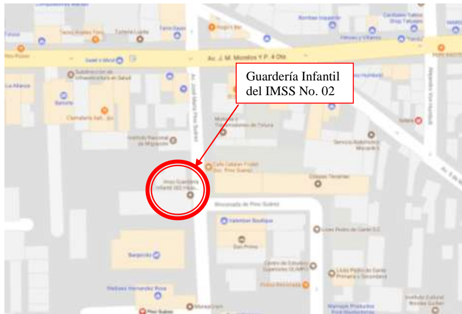
FIG. 1 CROQUIS DE LOCALICZACIÓN DE LA GUARDERÍA EN CUESTIÓN.