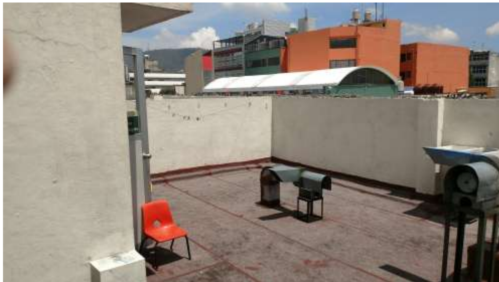
FOTOGRAFIA 4: VISTA DE AZOTEA IMPERMEABILIZADA Y SIN FILTRACIONES APARENTES