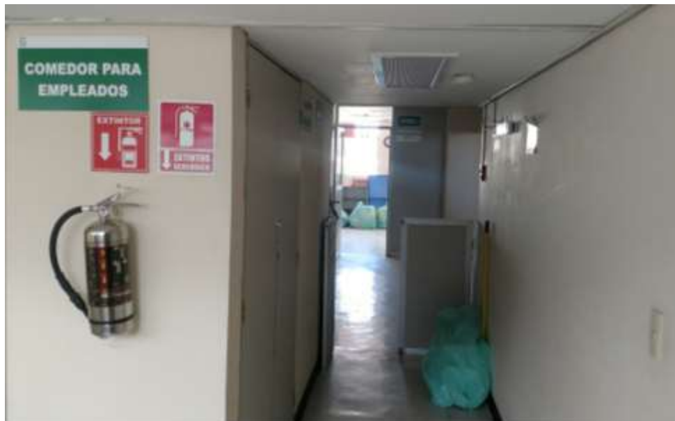
FOTOGRAFIA 2: PASILLO DE ACCESO A SERVICIOS Y VISTA DE MUROS.