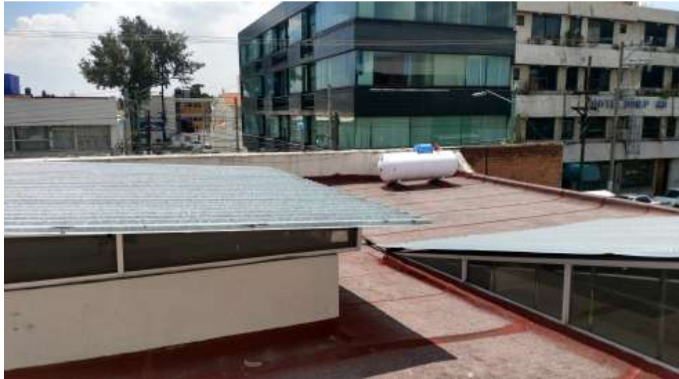
FOTOGRAFIA 5: VISTA DE AZOTEA IMPERMEABILIZADA Y CUBIERTAS LIGERAS