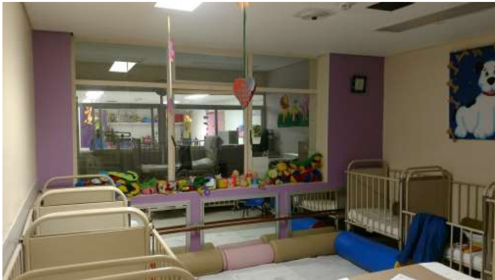
FOTOGRAFIA 10B: ÁREA DE LÁCTANTES