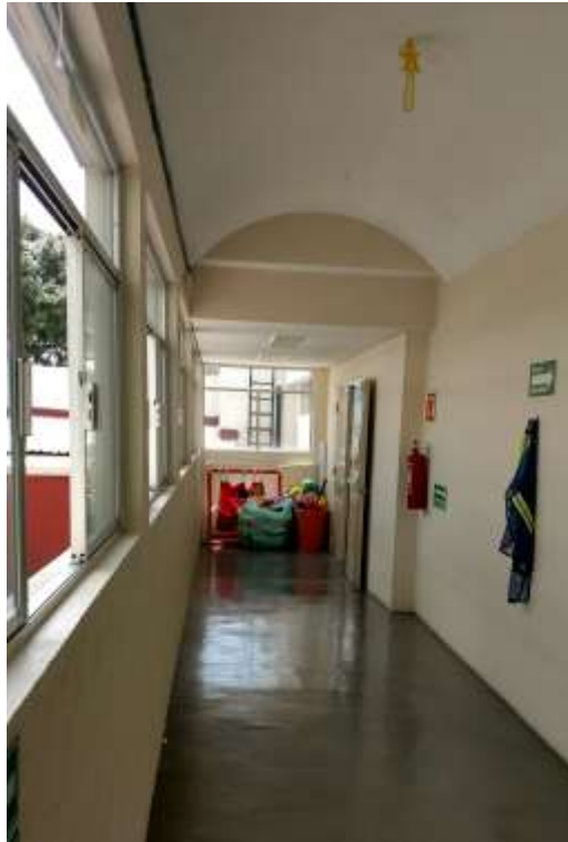
FOTOGRAFIA 7: PASILLO QUE COMUNICA AL ÁREA DE LÁCTANTES