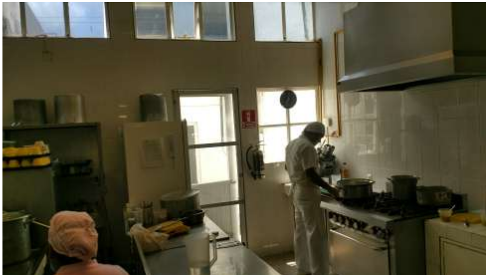
FOTOGRAFIA 9: ÁREA DE COCINA