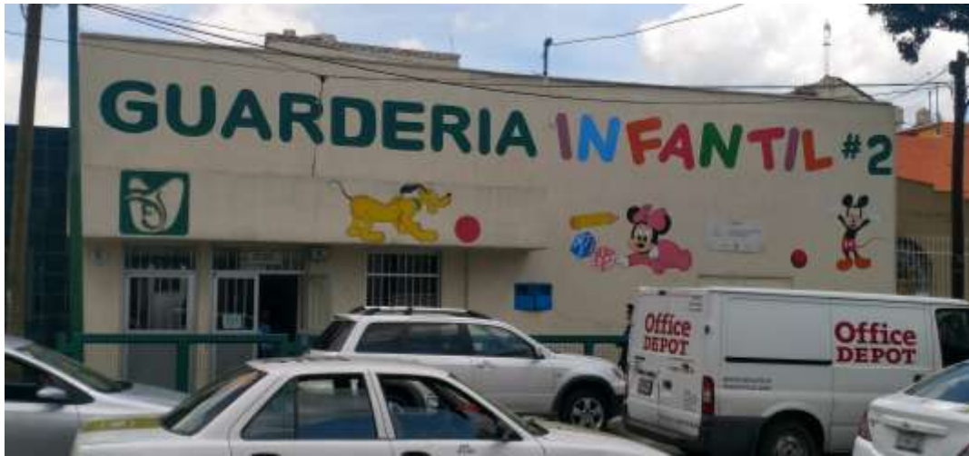
FOTOGRAFIA 1: FACHADA PRINCIPAL DE GUARDERÍA INFANTIL No. 02