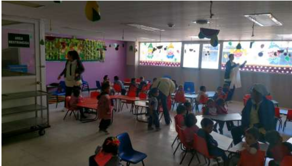
FOTOGRAFIA 3: COMEDOR INFANTIL