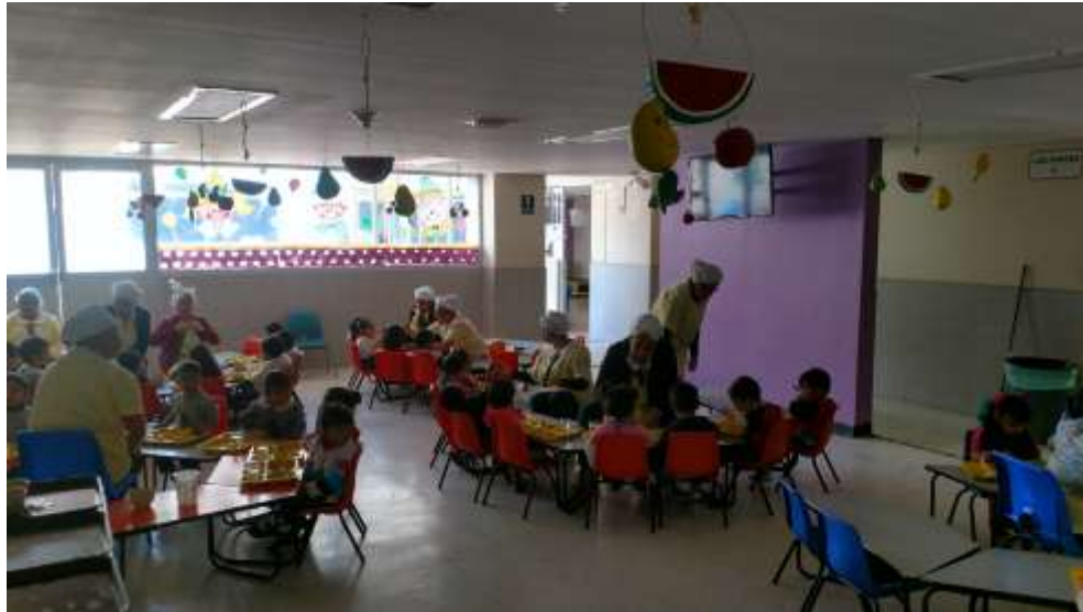
FOTOGRAFIA 10A: OTRA VISTA DEL COMEDOR INFANTIL