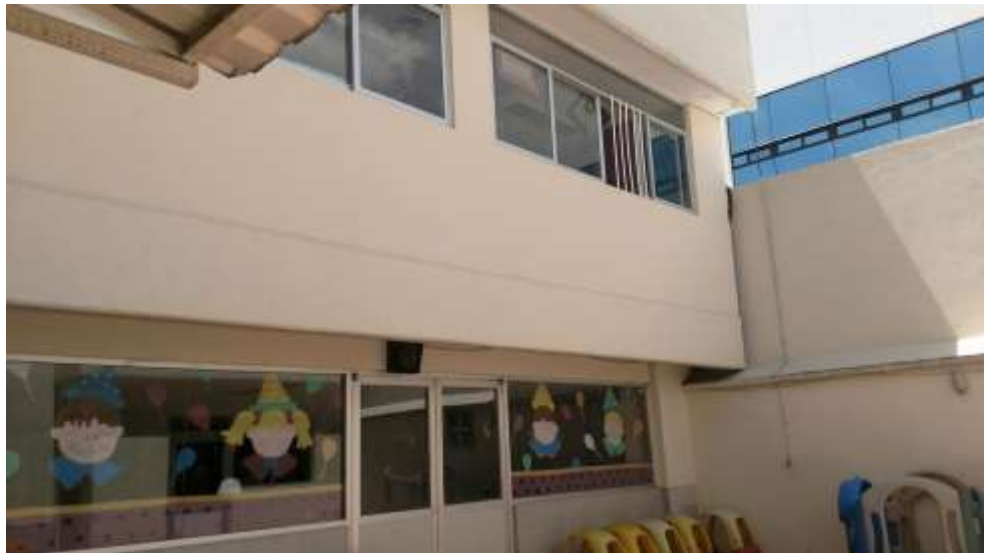
FOTOGRAFIA 6: VISTA DE FACHADAS INTERIORES