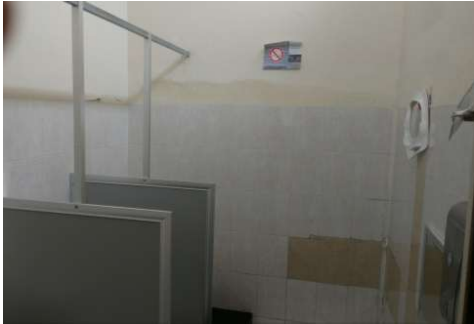
FOTOGRAFIA 8B: ÁREA DE BAÑOS