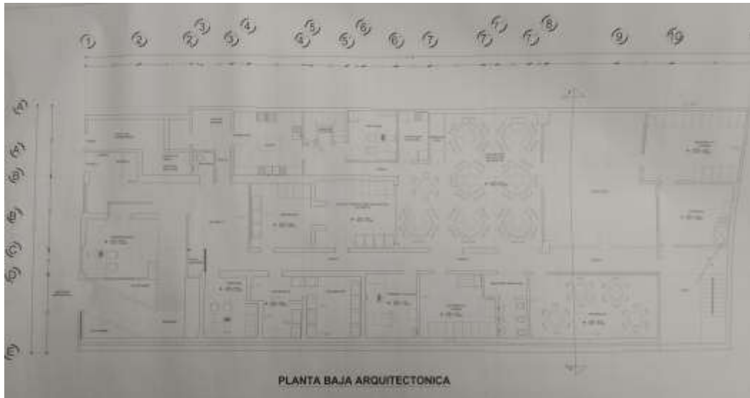
FIG. 3 PLANTA BAJA ARQUITECTÓNICA DE LA GUARDERÍA DEL IMSS No. 02