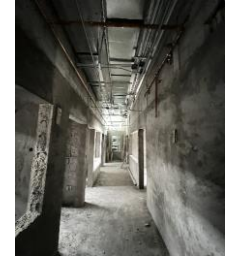
Vista de instalaciones y aplandados