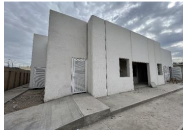
Vista de fachada posterior