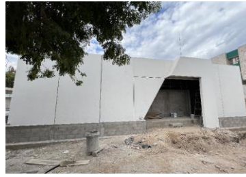
Vista de fachada principal