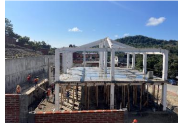
Colado de losa de entrespiso bloque 1 lado Noreste