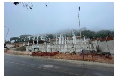
Colocacion de estructura bloque central