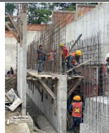
Armado, cimbrado y colado de muros de contención frontales MC-4 en rampa posterior a