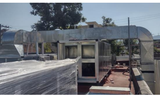
CONEXIÓN SUCTOS EQ. DE A.A.