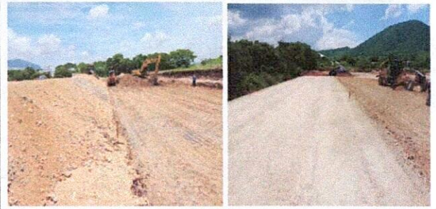
CONFORMACION DE PLATAFORMA 4 PAVIMENTOS