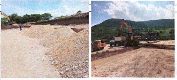
VERIFICACION DE NIVELES