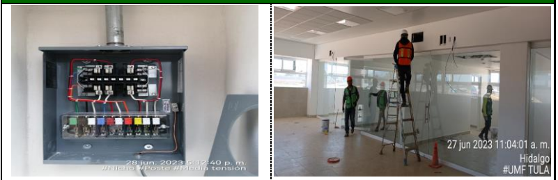
colocacion de la base para medicion en nicho