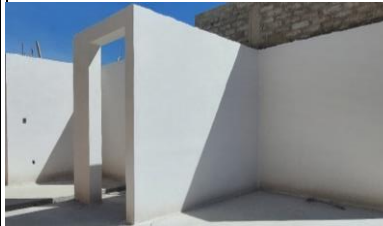
CUARTO DE MAQUINAS Y ENTRADA DE PERSONAL.