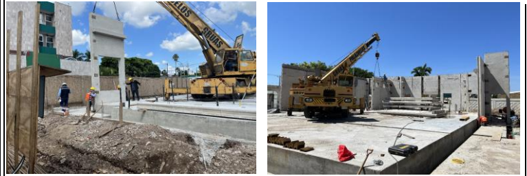
Se inicia colocación de muros prefabricados