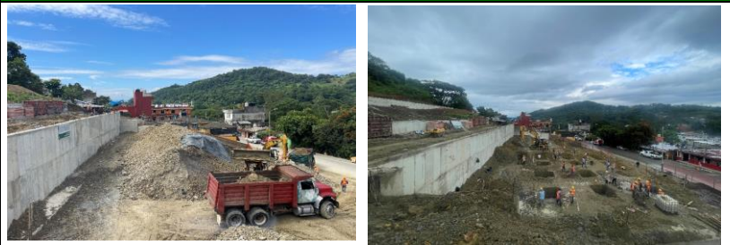
Retiro de material producto del corte de terreno, excavacion de cepa en zona de cisterna y muros de tension MC-3