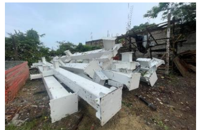
Suministro de columnas metalicas tipo HSS 356x15.9 altura 7.00 y 9.00 mts.en sitio