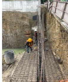
Habilitad y colocacion de acero de refuerzo para zapata y muros de tension MC-3 en zona de