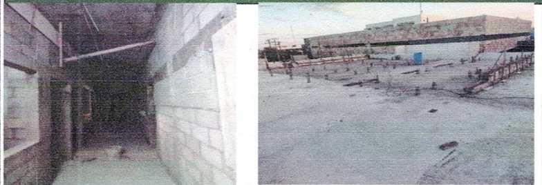
Albañilería en interior