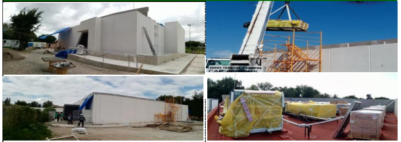
Vista panorámica del Centro de Mezclas (Ingreso Principal e Ingreso Personal)