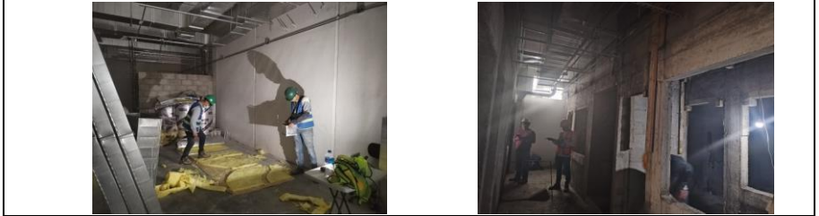
1. COLOCACIÓN DE FORRO