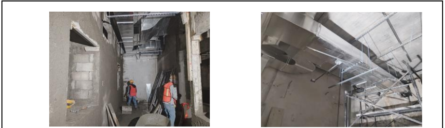
3.- APLANADO DE MUROS