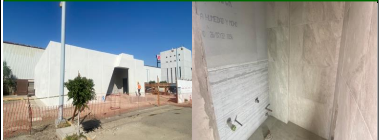
Vista principal, (sigue pendiente suministro de loseta para fachada) . Sobremuro de durock y loseta cerámica en muro de sanitario hombres.