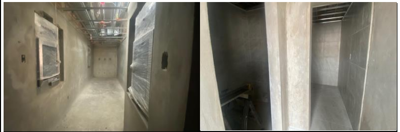
Área de acondicionamiento, esclusas instaladas. Colocación de loseta cerámica en piso y muro, sanitario mujeres y regadera.