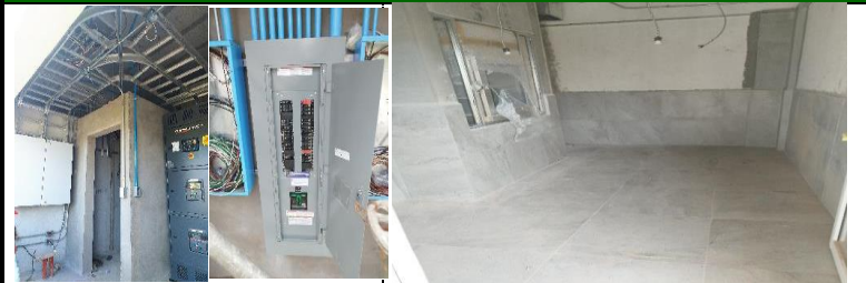
COLOCACION DE TABLERO DE INTERRUPTOR GRAL,TRANSFERENCIA Y TABLERO (AE) CON SUS INTERRUPTORES TERMOMAGNETICOS COLOCACION DE LOSETA CEMICA(EN PISOS Y MUROS)ACCESOS,SALA DE ESPERA,MATERIA PRIMA AREA DE ENTREGA)