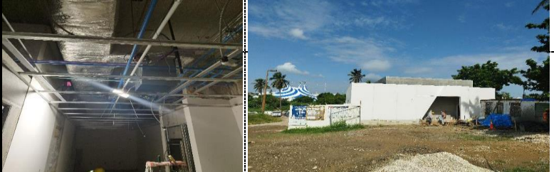
COLOCACION DE ANGULO PERIMETRAL Y ESTRUCTURA PARA PLAFON PANORAMICA DE LA CENTRAL DE MEZCLAS