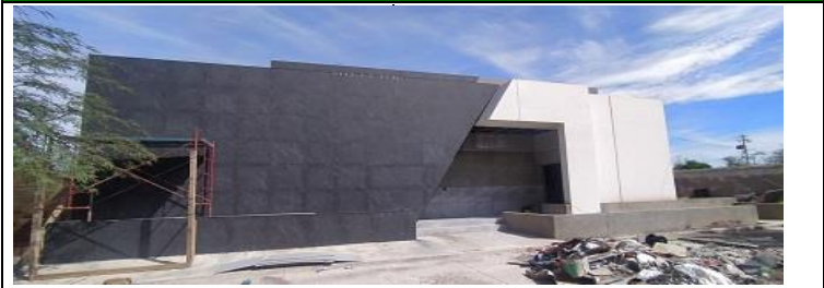
FACHADA PRINCIPAL CON PORCELANATO