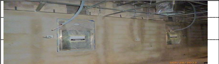
ESCLUSAS SENCILLAS EN AREA DE ACONDICIONAMIENTO