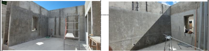
COLOCACION DE TUBERIA CONDUIT Y RESANES EN MUROS DE LABORATORIO.