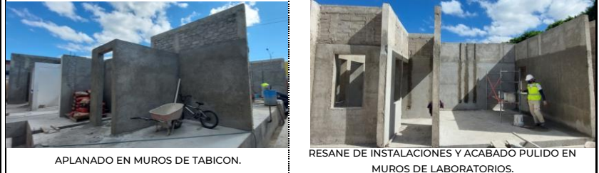
APLANADO EN MUROS DE TABICON.