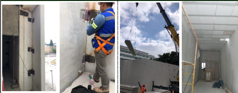
soldadura de placas en muros precolados y pruebas de laboratorio Colocación de Losas Alveolares y de Vigueta y Bovedilla