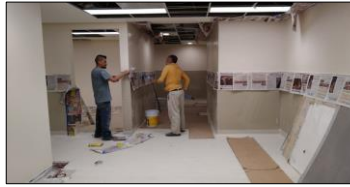
Suministro y colocación de pasta Corev en muros de pasillos.