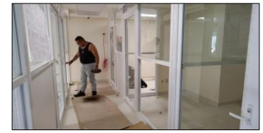
Suministro y colocación de recubrimiento en tableros de la cancelería de Oficinas de Patólogos.