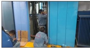
Colocación de interruptor de 3 x 150 A en subestación de la UMAE Hospital de Oncología, tablero de emergencia.