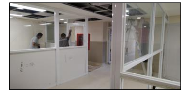
Suministro y colocación de cristales en cancelería interior en los locales de sala de juntas y anexos.